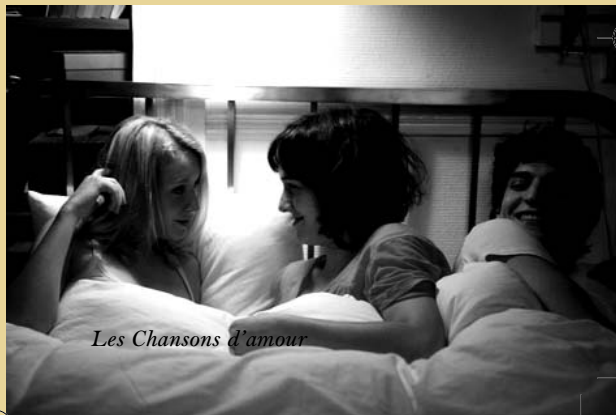
Les Chansons d'amour

Films de Sam Raimi disponibles au vidéoclub du Lux : Darkman, Evil Dead, Evil Dead 2, Intuitions, Mort ou vif, Un plan simple (vhs) Spiderman, Spiderman 2 (dvd)