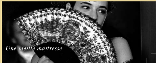
Une vieille maitresse

Protégé par Fern, la fille du fermier, le chétif cochon Wilbur grandit sous l'oeil maternel de l'araignée Charlotte. Jusqu'au jour où le voilà bon à manger... L'heure du sacrifice approchant, la basse cour tremble à l'idée de perdre la rose créature. C'est alors que Charlotte trouve la parade en tissant la plus belle de ses toiles... Cette fable enfantine où les animaux, réels et bien vivants, sont tous dotés de la parole, est aussi drôle que merveilleuse.