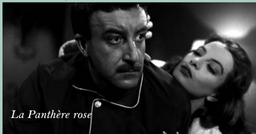
La Panthère rose

Films de Blake Edwards disponibles au vidéoclub du Lux : Intégrale Panthère Rose : 6 épisodes (dvd) ; La Partie, Victor Victoria (vhs)