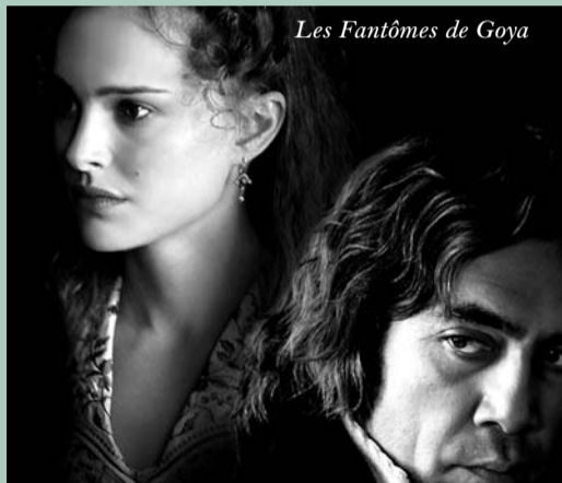
Les Fantômes de Goya

innocence... La Femme au gardénia est le premier de trois films que Lang a consacrés aux médias (avec La Cinquième victime et L'In vraisemblable vérité). La trame policière y est prétexte à une vision féroce de l'American way of life, tant au travers de la description de l'univers féminin de l'héroïne, que de celui, masculin, du journaliste. Les deux mondes se révélant dépendants l'un de l'autre : fascination de Norah et de ses amies pour les faits-divers mélodramatiques ou sanglants, cynisme et arrivisme d'Archie, drogué, aux histoires de meurtre et de sexe. En fait, et sous des dehors légers et faciles, Fritz Lang soulignait dès 1953 certains des aspects quasi schizophréniques de la société américaine.