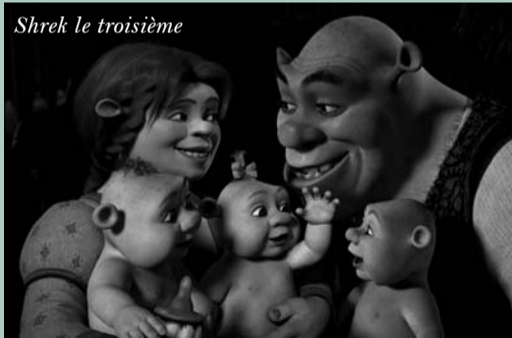
Shrek le troisième

En 2016, la mode et les critères de beauté ont beaucoup changé. Une nouvelle tendance fait des ravages chez les jeunes : le lifting du visage. Georges, un jeune diplômé récemment lifté, profite des vacances d'été pour s'intégrer aux "Chivers", une bande de caïds liftés à l'extrême. Blaise, un loser rejeté et ex-ami d'enfance de Georges, aimerait lui aussi faire parti de la bande... «On pouvait craindre une daube sans nom, et on se retrouve avec un film profondément atypique (...) entre éloge de l'idiotie fondamentale et satire de l'époque...» (Libération)