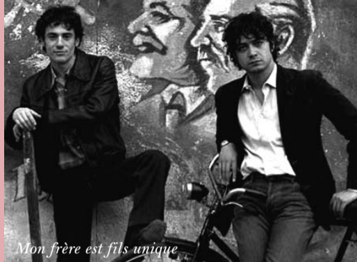
Mon frère est fils unique

Accio, La Teigne, crée le désespoir de ses parents. Il est farouche, polémique, bagarreur et a les nerfs à fleur de peau. Il agit par instinct, vivant chaque bataille comme une guerre. Son frère Manrico est beau, charismatique, aimé de tous, mais tout aussi dangereux... Dans la province italienne des années 60 et 70, les deux jeunes hommes se battent sur deux fronts politiques opposés, ils aiment la même femme et traversent, dans une confrontation sans fin, une période de leur vie faite de fugues, de retours, d'échanges de coups et de grandes passions. C'est l'histoire de leur parcours pendant 15 ans d'une histoire italienne... Servi par une brochette d'interprètes enthousiasmants, le film est surtout le portrait de celui qui se surnomme lui-même «la teigne» remarquablement interprété par un jeune acteur charmeur et touchant : Elio Germano.