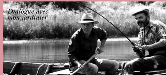
Dialogue avec mon jardinier

Tarifs habituels du Cinéma pour l'ensemble de la soirée