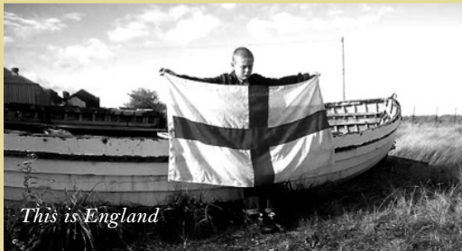
This is England