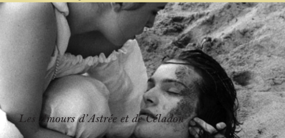
Les Amours d'Astrée et de Céladon

Films d'Eric Rohmer disponibles au vidéoclub du Lux : L'Ami de mon amie, L'Arbre, le maire et la médiathèque, La Collectionneuse, Conte de printemps, Conte d'été, Conte d'hiver, La Femme de l'aviateur, Ma nuit chez Maud, Les Nuits de la pleine lune, Le Signe du lion (VHS) ; Conte d'automne (DVD)