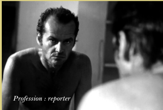
Profession : reporter

Films de Wim Wenders disponibles au vidéoclub du Lux : Buena Vista Social Club, The End of Violence, L'Etat des choses, Jusqu'au bout du monde, The Million Dollars Hôtel, Nick's Movie, Paris Texas (VHS)