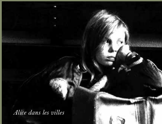
Alice dans les villes

Films de Wim Wenders disponibles au vidéoclub du Lux : Buena Vista Social Club, The End of Violence, L'État des choses, Jusqu'au bout du monde, The Million Dollars Hôtel, Nick's Movie, Paris Texas (VHS)