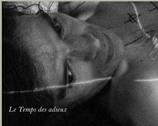
Le Temps des adieux