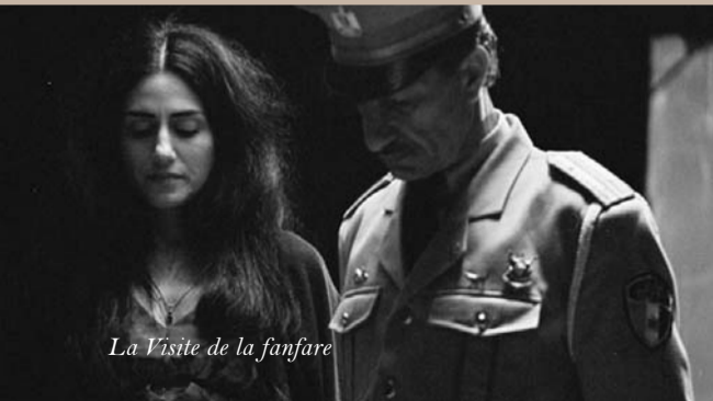
La Visite de la fanfare

Cannes 2007 : Prix de la critique Internationale ; Prix de la Jeunesse ; Coup de Coeur d'Un Certain Regard