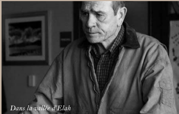
Dans la vallée d'Elah

Un vétéran de guerre et sa femme partent à la recherche de leur fils, un soldat mystérieusement disparu après son retour d'Iraq. L'aide d'un officier de police ne sera pas de trop pour tenter de faire tomber les murs dressés sur leur route, en premier lieu par l'armée américaine... Sous la forme captivante d'un thriller policier, Paul Haggis dénonce les horreurs du conflit. Porté par un Tommy Lee Jones exemplaire, son réquisitoire résonne aussi comme le glas du rêve américain.