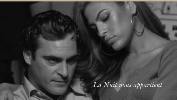
La Nuit nous appartient