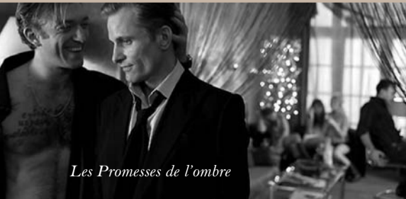
Les Promesses de l'ombre

L'univers de l'enfance à travers quatre histoires qui font grandir. Des films tout en poésie et en tendresse. «L'enfant sans bouche» : Il était une fois, un enfant qui n'avait pas de bouche... et un lapin qui avait de bien grandes oreilles ! «Les pierres d'Aston» : Aston ramasse les pierres qu'il trouve sur le chemin de la maison. Il les dorlote, les lave et leur fabrique des petits lits douilletts mais ses parents commencent à trouver sa collection un peu envahissante... «Les abricots» : La journée d'un petit garçon passée à la plage en compagnie de son oncle et la découverte de la mer sous un autre jour... «Lola s'est perdue» : Lola, le petit pigeon, vient d'emménager dans une nouvelle maison. Partie faire une course, à son retour, elle s'aperçoit que toutes les maisons sont absolument identiques. Comment alors retrouver son chemin ?