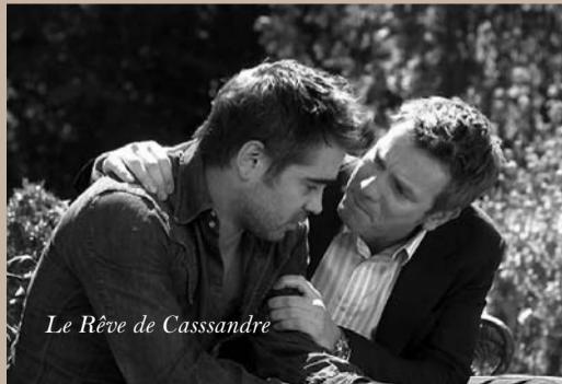
Le Rêve de Cassandre

Cody Maverick, un surfer amateur - pingouin – se lance dans la compétition. Il est persuadé que le succès lui apportera l'admiration et le respect qu'il n'a jamais eu jusque là. Mais sa rencontre inopinée avec un vieux surfer appelé le Geek, va peu à peu lui faire comprendre qu'un grand champion n'est pas forcément celui qui arrive le premier... Avec son allure de reportage-animé (idée brillante), ce film d'animation 100% fun (mais pas décerébré) regorge de trouvailles ludiques (Nelson Monfort aux commentaires, un must !) et carbure à l'humour pour tous.