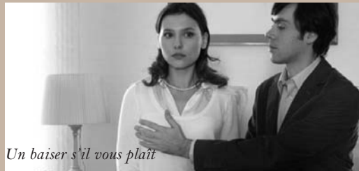
Un baiser s'il vous plaît

Rencontre avec l'équipe du film le jeudi 13 décembre Réservations conseillées (pré-ventes sur place aux horaires de caisse)