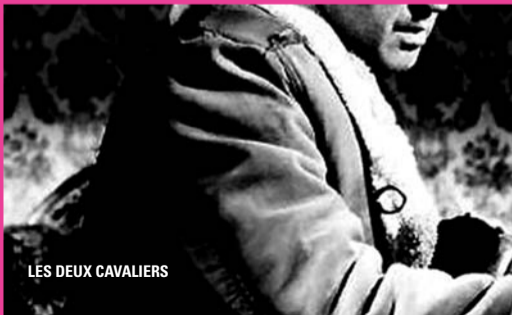
LES DEUX CAVALIERS

Voir résumé de ces films dans les pages « A l'affiche »