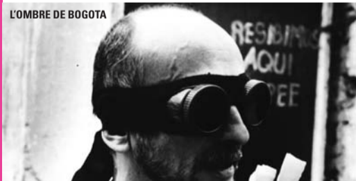
L'OMBRE DE BOGOTA

Mañe habite les quartiers pauvres de Bogota. Après avoir perdu l'usage de ses jambes, il ne parvient plus à retrouver du travail et à payer son loyer. Alors que sa situation semble désespérée, il rencontre un personnage étrange qui arpente les rues de la cité en portant des gens sur son dos pour 500 pesos. Il va retrouver espoir en se liant d'amitié avec le mystérieux porteur... Tourné avec une poignée de dollars, La Sombra del Caminante est un film social qui aborde les thèmes de l'amitié et des relations humaines au cœur de la misère et de la pauvreté de Bogota. Loin des clichés et documentaires sur la violence certaine des bidonvilles des grandes cités d'Amérique du Sud, le jeune réalisateur colombien fait preuve d'une rare maturité pour nous conter cette aventure humaine avec pudeur et retenue.