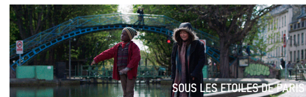
SOUS LES ETOILES DE PARIS