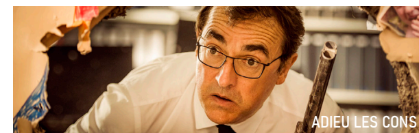
ADIEU LES CONS