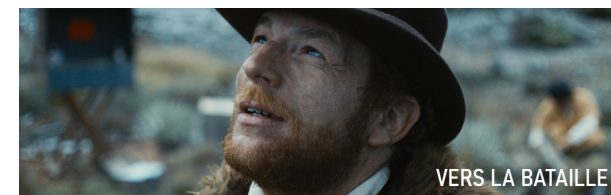
VERS LA BATAILLE

CINÉMA LUX | AVENUE SAINTE-THÉRÈSE | CAEN