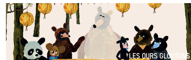
LES OURS GLOUTONS

CINÉMA LUX | AVENUE SAINTE-THÉRÈSE | CAEN