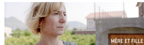
MÈRE ET FILLE