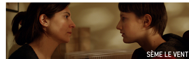
SÈME LE VENT