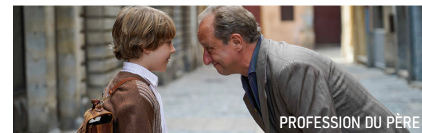
PROFESSION DU PÈRE

CINÉMA LUX | AVENUE SAINTE-THÉRÈSE | CAEN