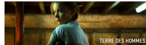
TERRE DES HOMMES