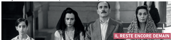
IL RESTE ENCORE DEMAIN