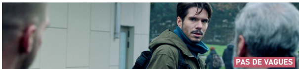
PAS DE VAGUES