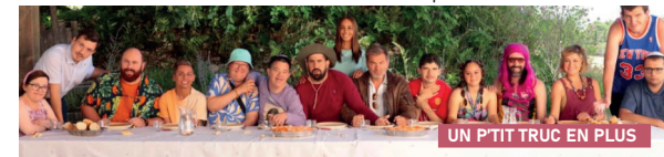
UN P'TIT TRUC EN PLUS