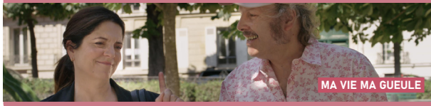
MA VIE MA GUEULE