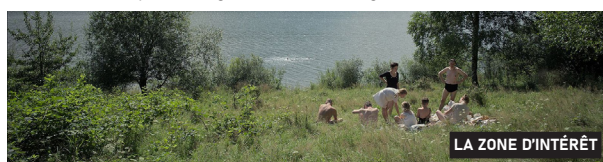
LA ZONE D'INTÉRÊT

Rudolf Höss, commandant nazi, vit avec son épouse et ses enfants dans un « charmant » pavillon juxtaquant le camp d'Auschwitz. Une existence paisible radiographiée à travers un dispositif angoissant et interrogateur.