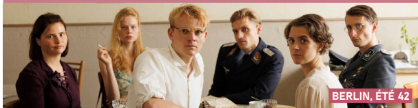
BERLIN, ÉTÉ 42

■ Sélection compétition officielle - Festival de Berlin 2024