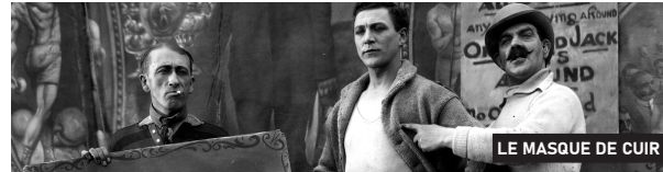
LE MASQUE DE CUIR