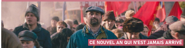
CE NOUVEL AN QUI N'EST JAMAIS ARRIVÉ

« Véritable tour de force, Ce nouvel an qui n'est jamais arrivé de Bogdan Muresanu est un film choral sur les derniers jours de la dictature de Ceausescu. Un premier film roumain sur l'importance du collectif pour vaincre l'oppression, comme une piqûre de rappel de l'histoire de l'Europe contemporaine. »