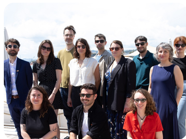
(Toute l'équipe de l'AFCAE)

Interview réalisée par BENJAMIN GENISSEL