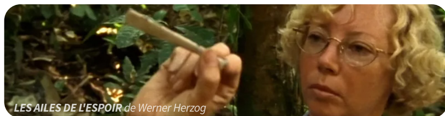
LES AILES DE L'ESPOIR de Werner Herzog