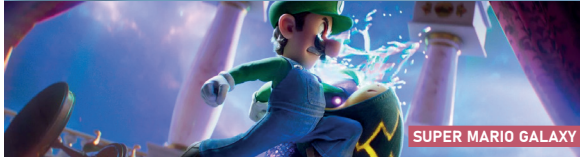
SUPER MARIO GALAXY

FILM D'ANIMATION DE AARON HORVATH, AMÉRICAIN (VF), 2026-1H39. À PARTIR DE 7/8 ANS. Mario et Luigi à reprennent du service et plongent dans les zones d'ombre du passé de la princesse Peach à travers un périple intergalactique