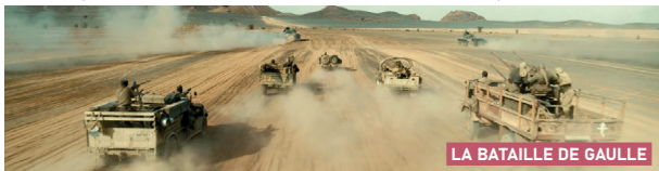
LA BATAILLE DE GAULLE

Londres pour sauver ce qu'il reste d'un rêve : la liberté. Sans armée, sans appui, sans espoir. Mais avec une folle conviction : la France, sa France, n'a pas déposé les armes. Il tente un ultime pari : convaincre le monde que la bataille de France n'est ni terminée, ni perdue.